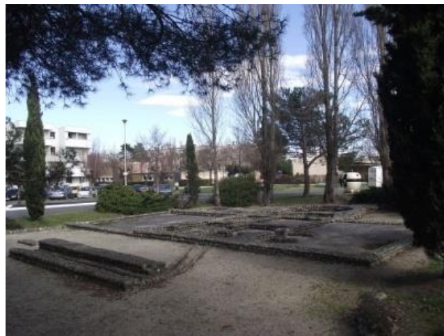
Tarbes, Antzinaroko villae baten zimenduak (Turba)