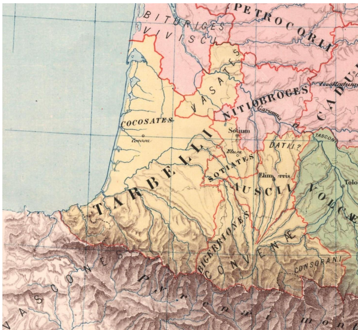
Antzinako Akitania, K. a. I. mendean (Auguste Longnon, 1885)