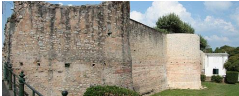
Akizeko galo-erromaniko harresiak (Aquae Tarbellicae)