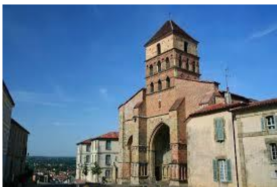
Aturako Santa Kitaria eliza (Atura/Aturri)