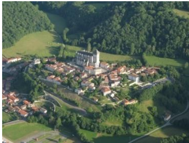
Saint-Bertrand-de-Comminges (Lugdunum Convenarum)