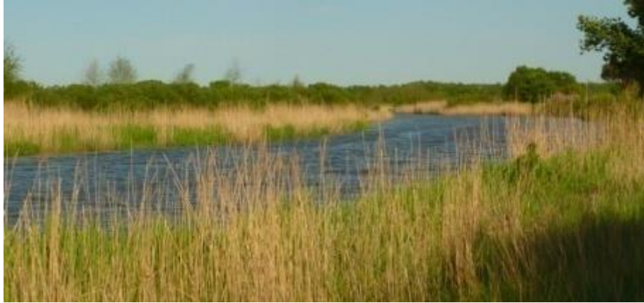
Eyreko delta, Lamotheetik hurbil (Boios)