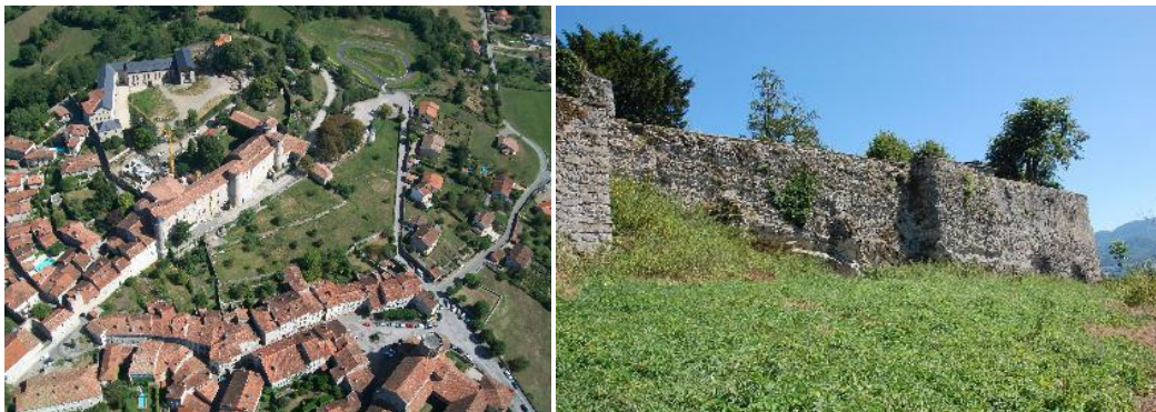
Saint-Lizier-en-Couserans eta bere harresiak (Conсорanni Sanctus Glycerius)