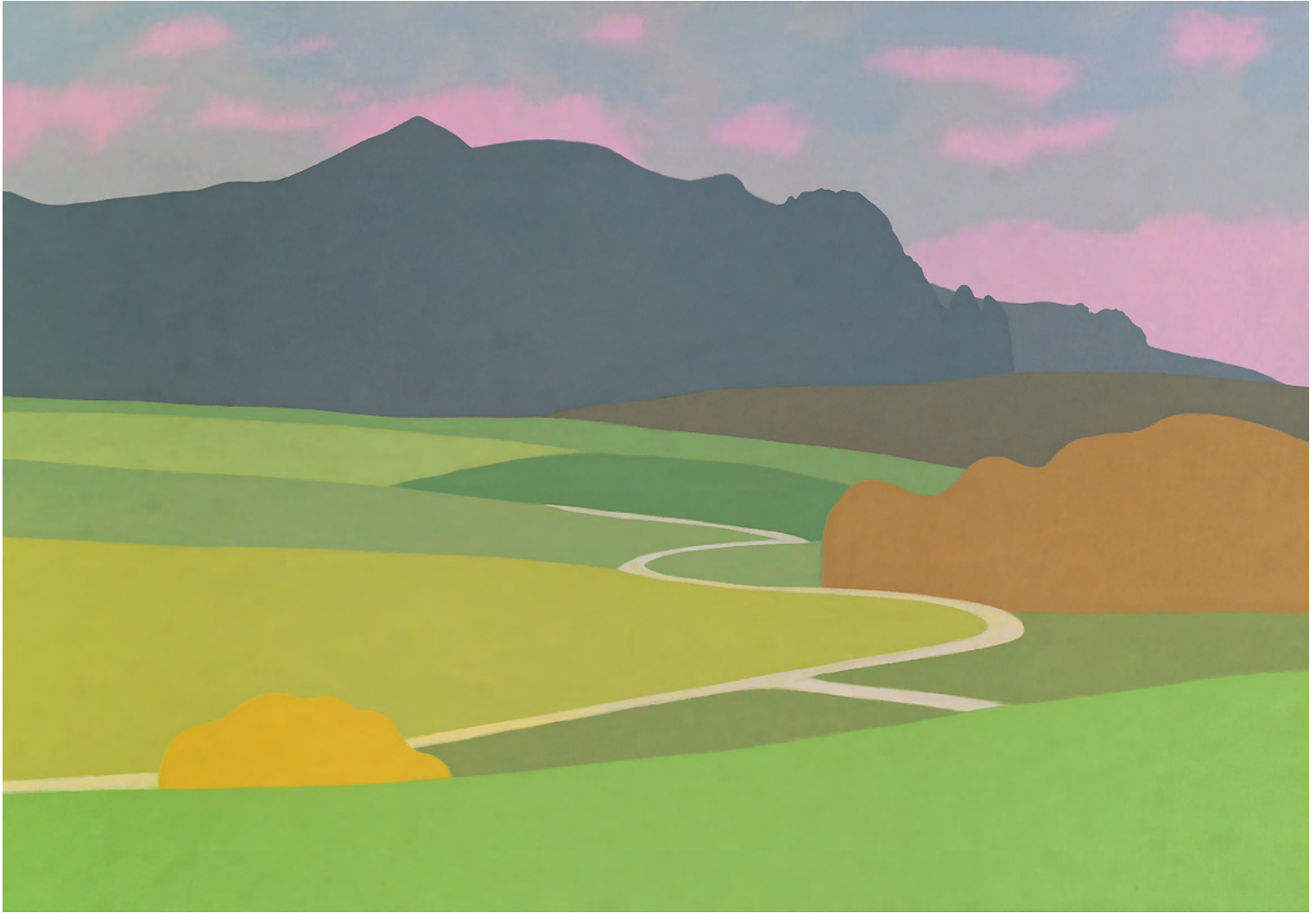
Caminos 81x116 cm. o/l