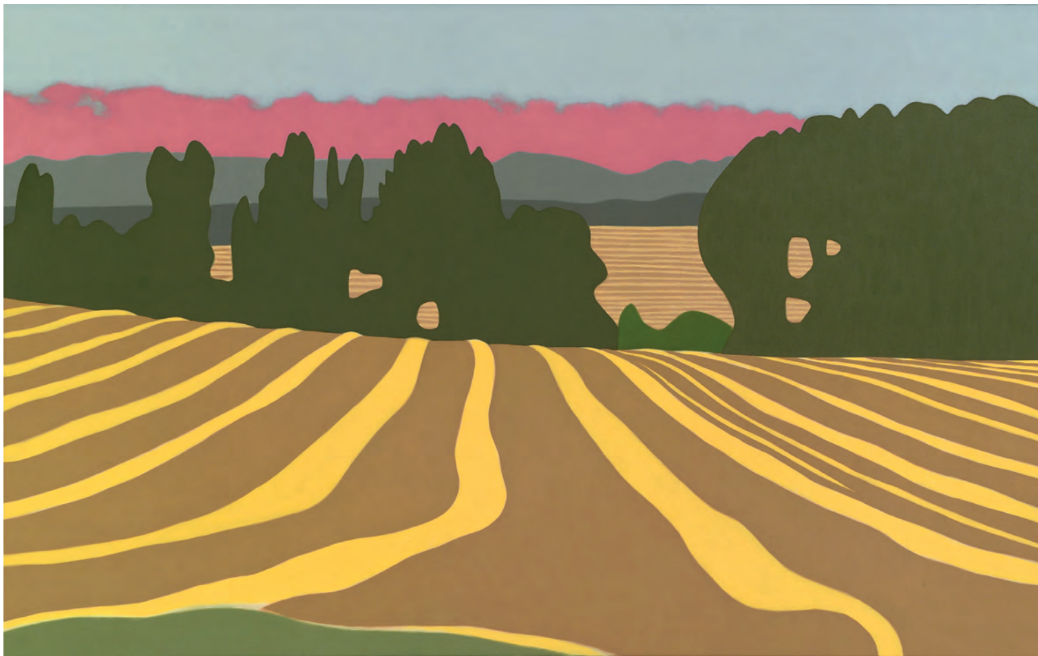
Campos trillados 73x116 cm. o/l