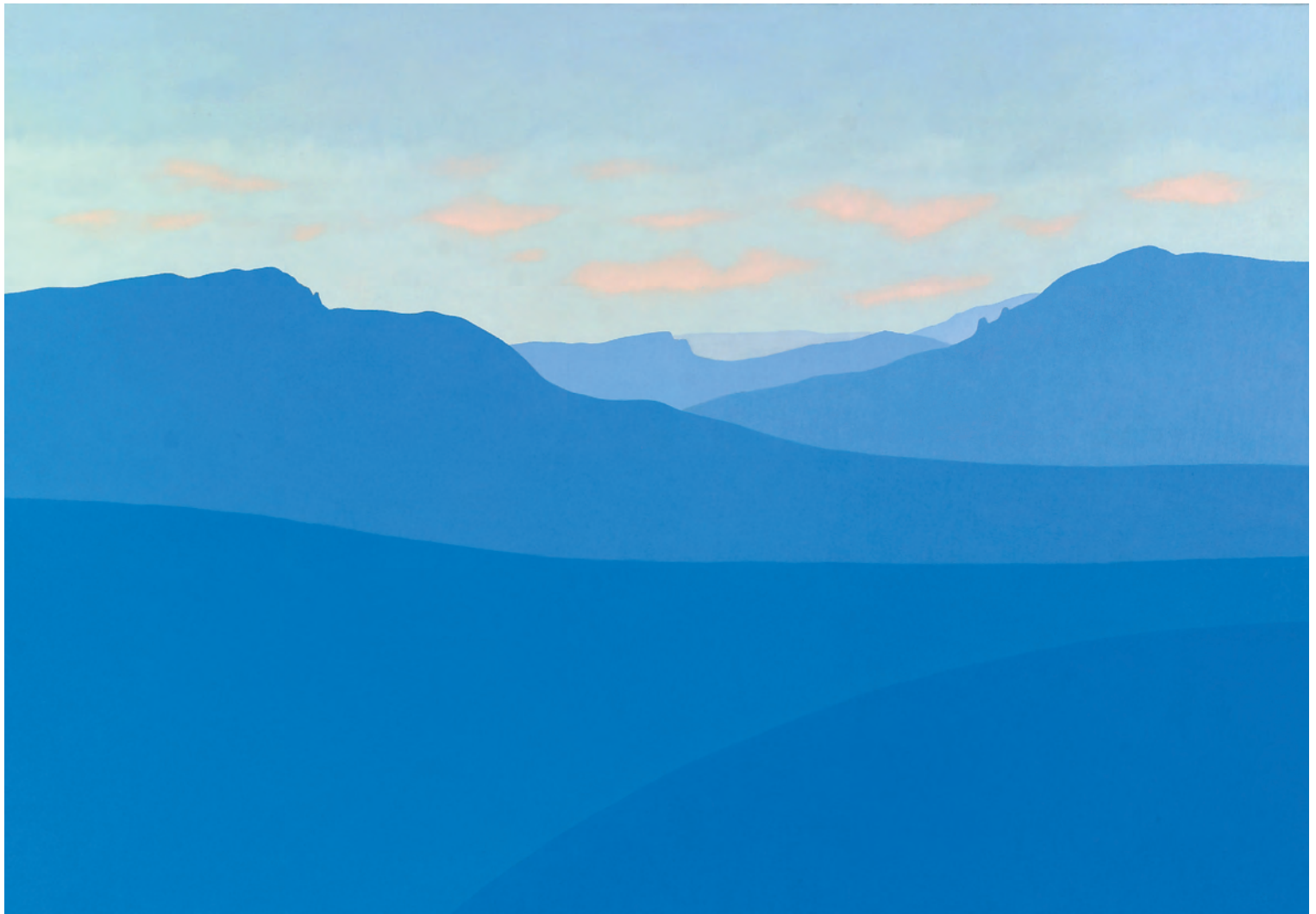
Balcón de Pilatos 81x116 cm. o/l