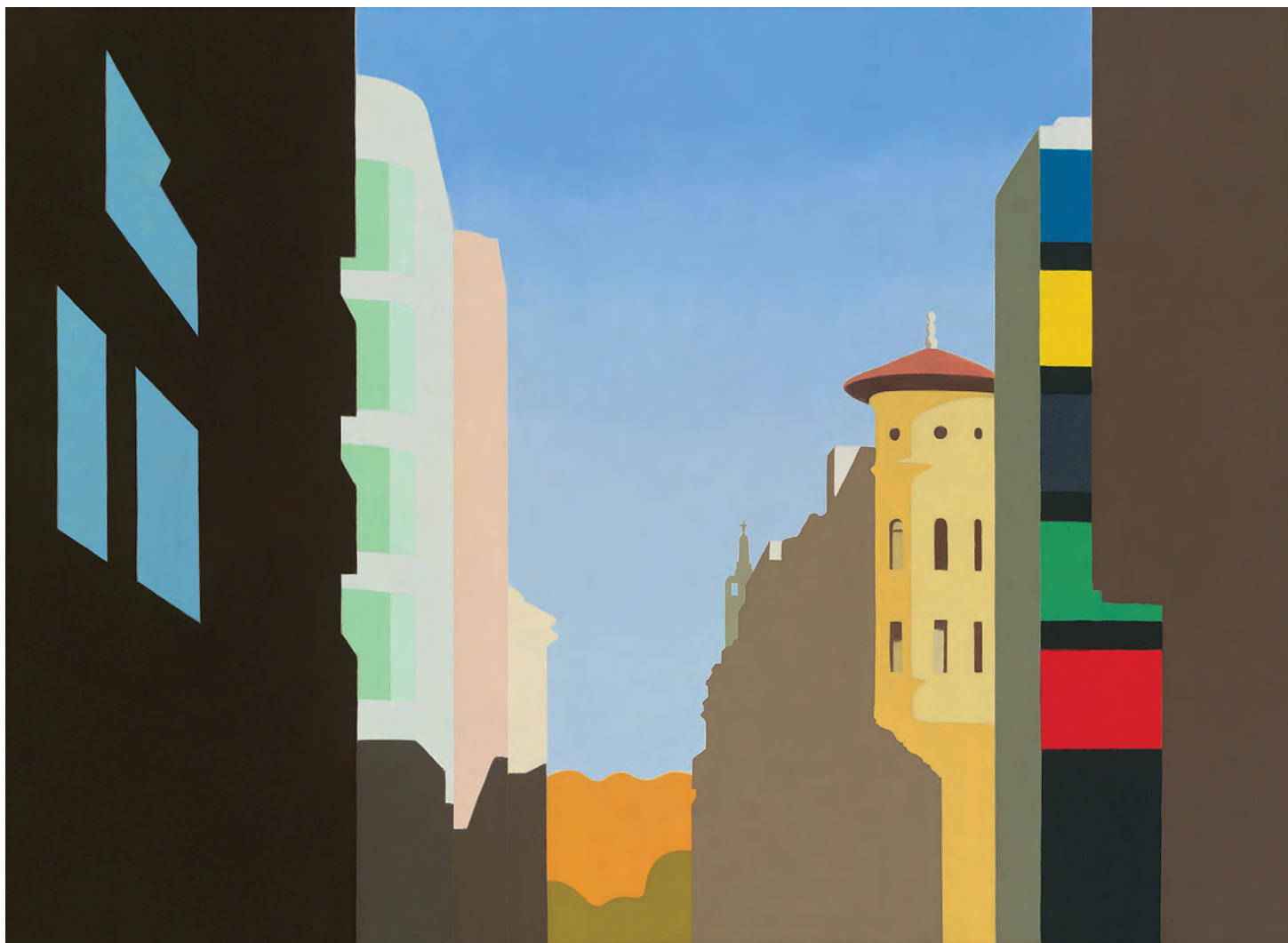
Calle Emilio Arrieta 73x100 cm. o/l