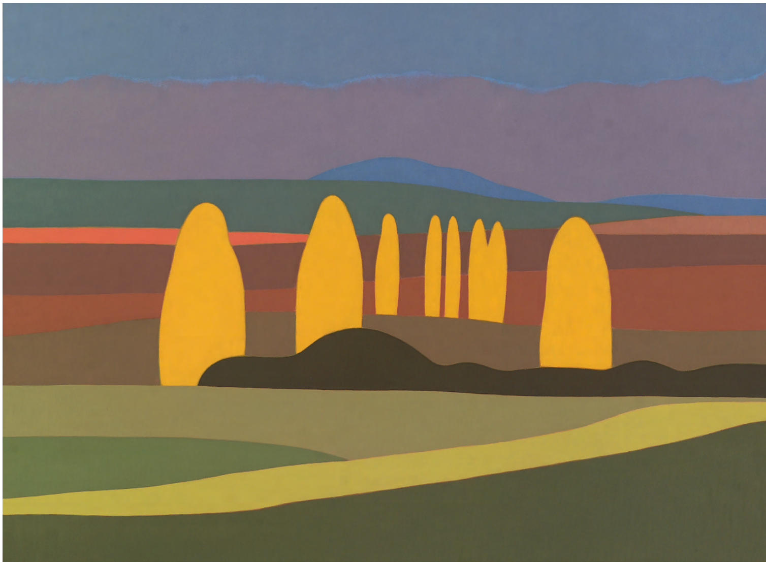
Amarillo 73x100 cm. o/l