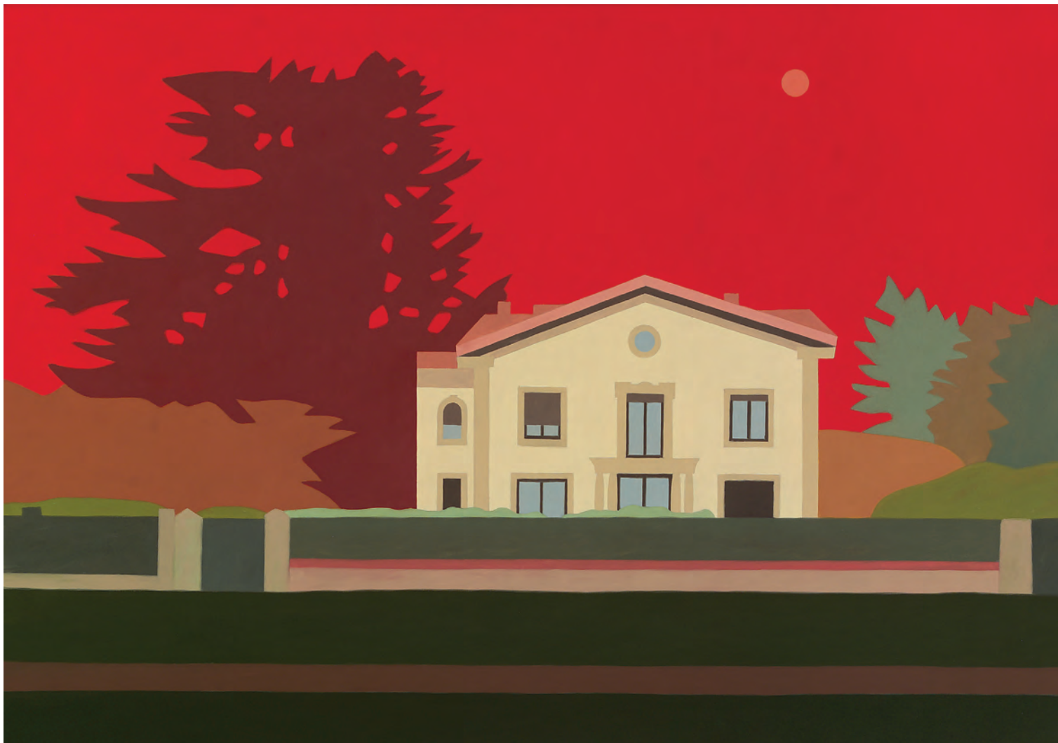
Avenida Baja Navarra 81x116 cm. o/l