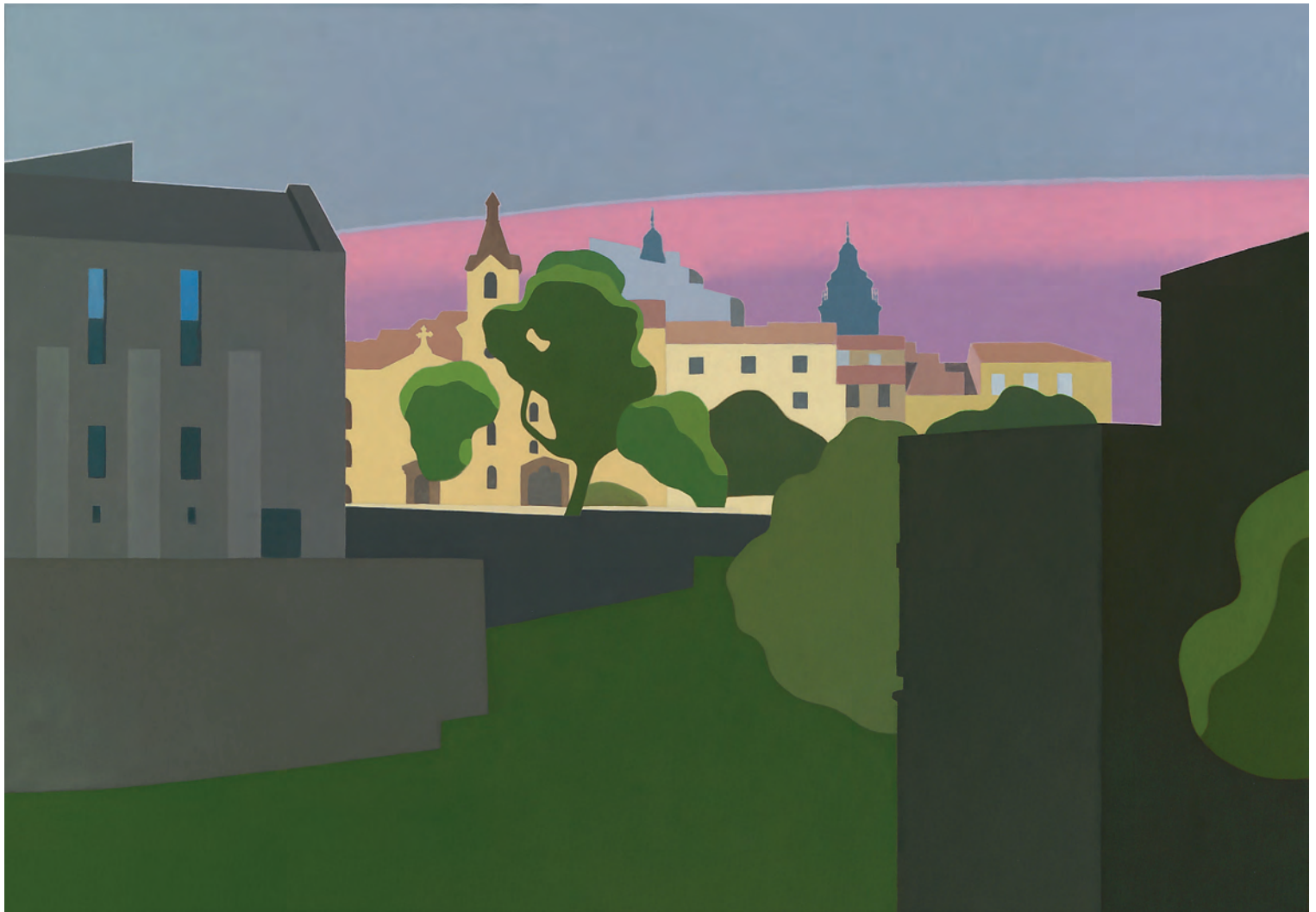
Corazonistas 81x116 cm. o/l