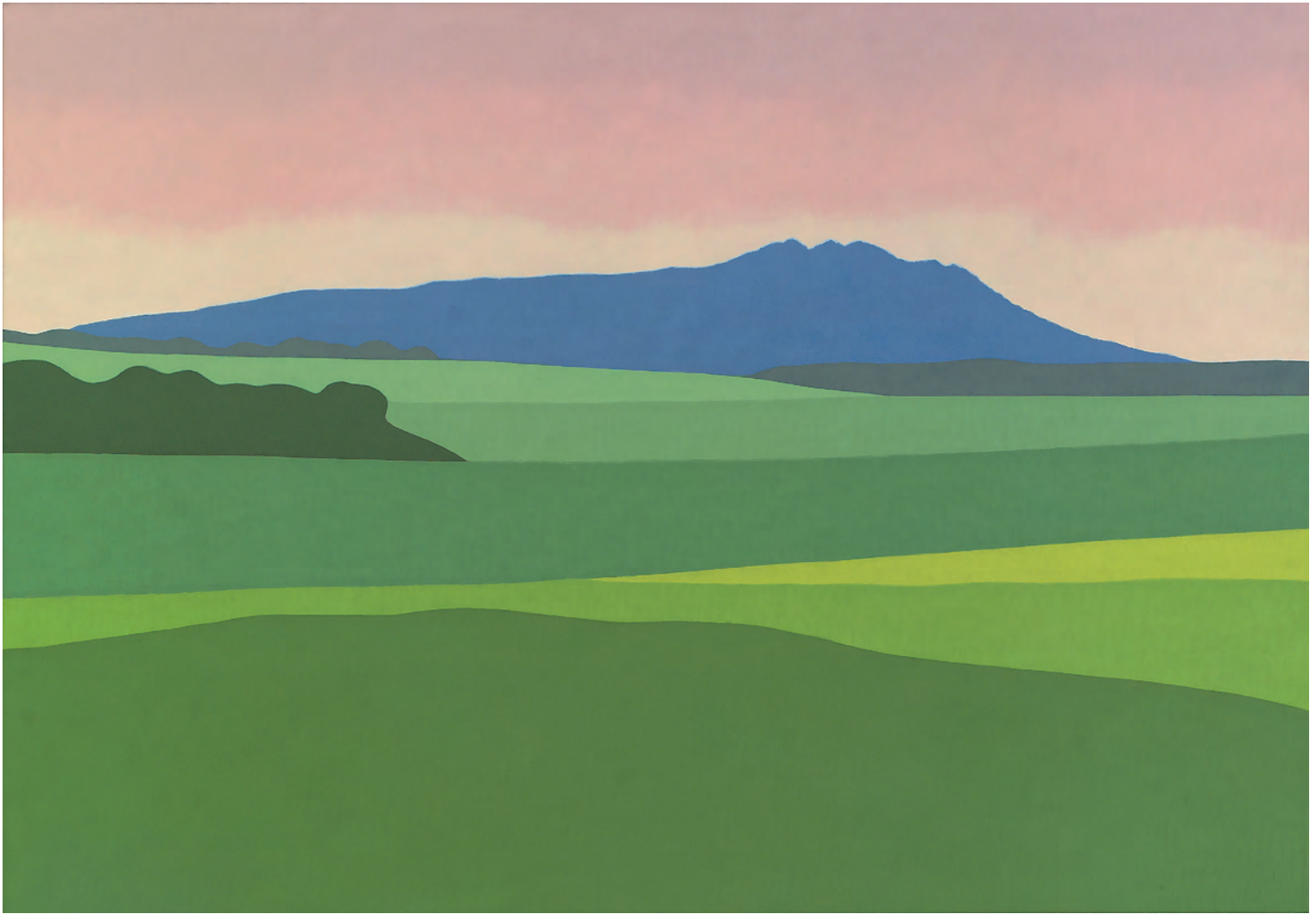
Montejurra 81x116 cm. o/l