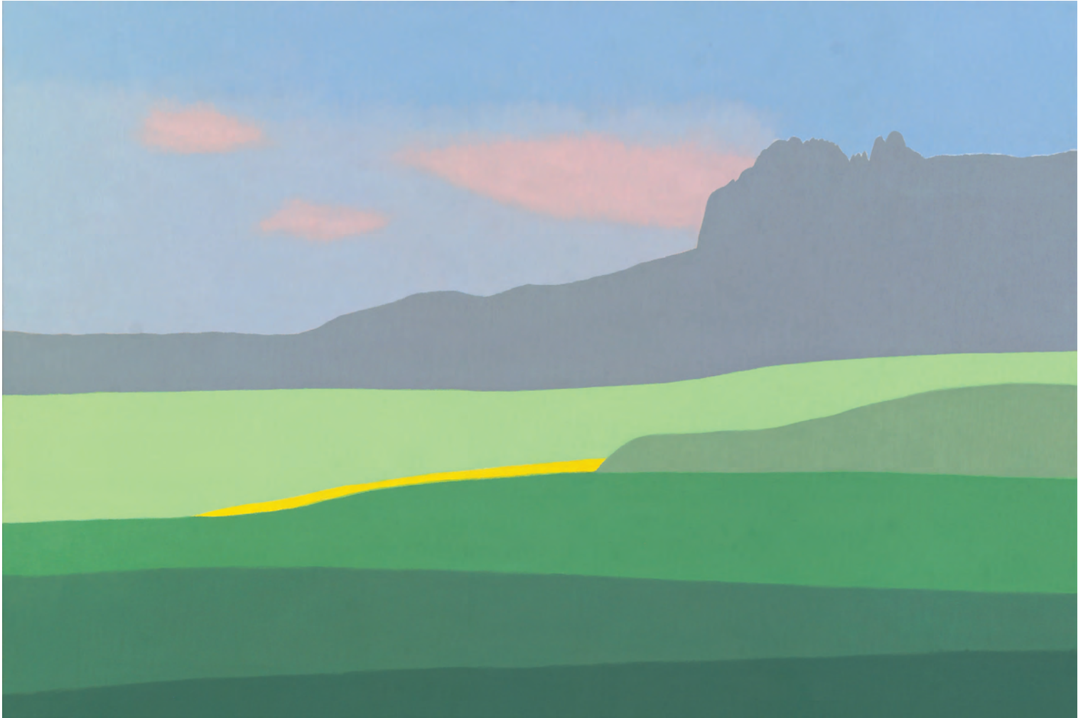
Campos de Mendaza 54x73 cm. o/l