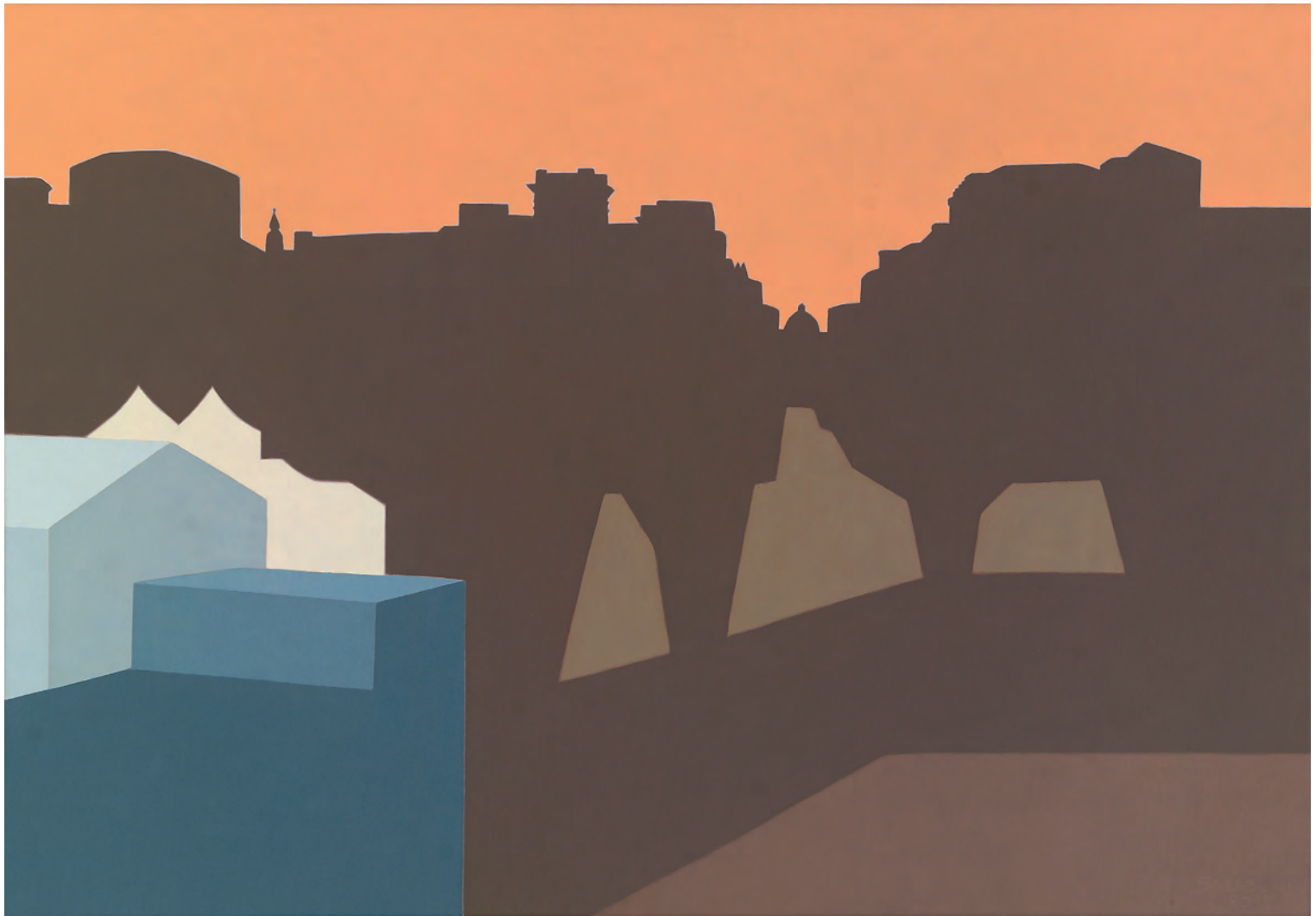
Desde mi estudio X 81x116 cm. o/l