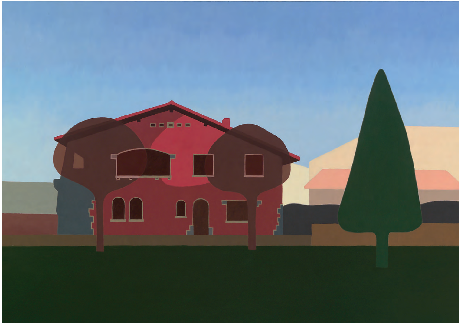
Media Luna 81x116 cm. o/l