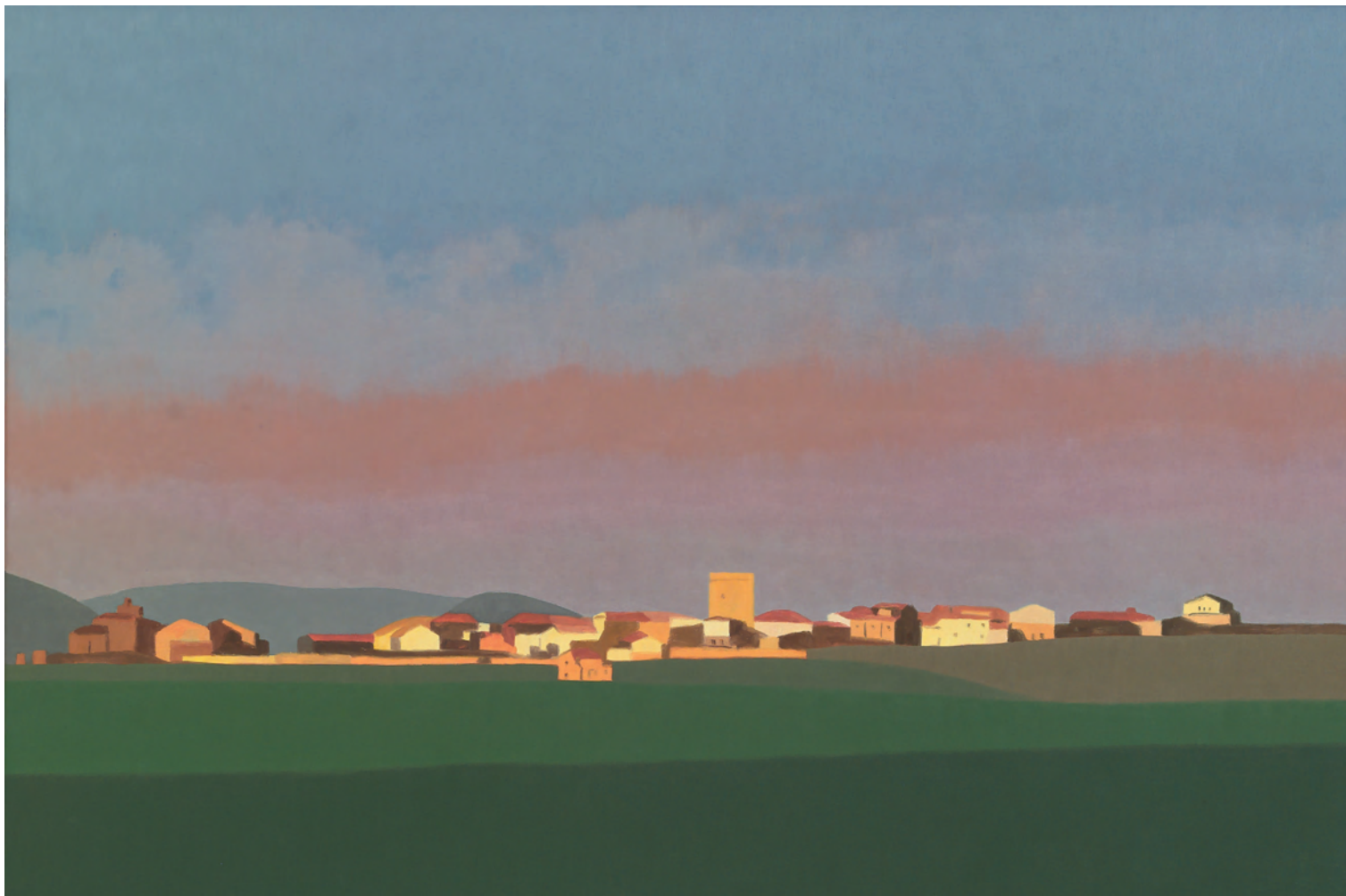
Olcoz 54x81 cm. o/l