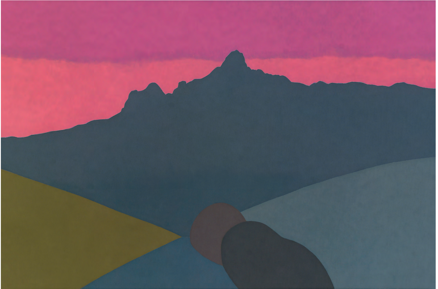
Chipeta 73x100 cm. o/l