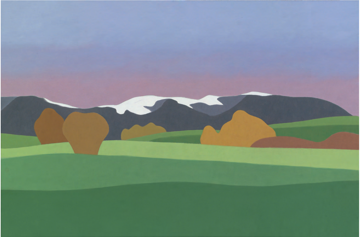
Ortanzurieta 54x73 cm. o/l