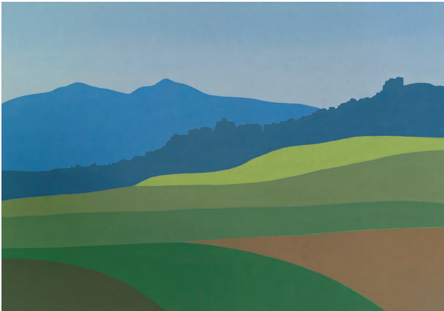
Gallipienzo 81x116 cm. o/l