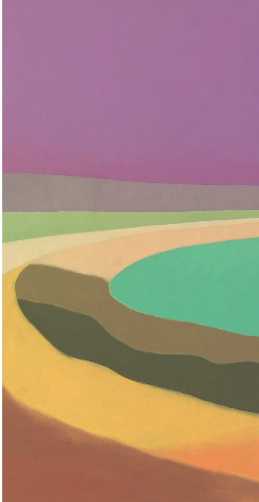
Plaza del Orfeón Pamplonés 73x116 cm. o/l