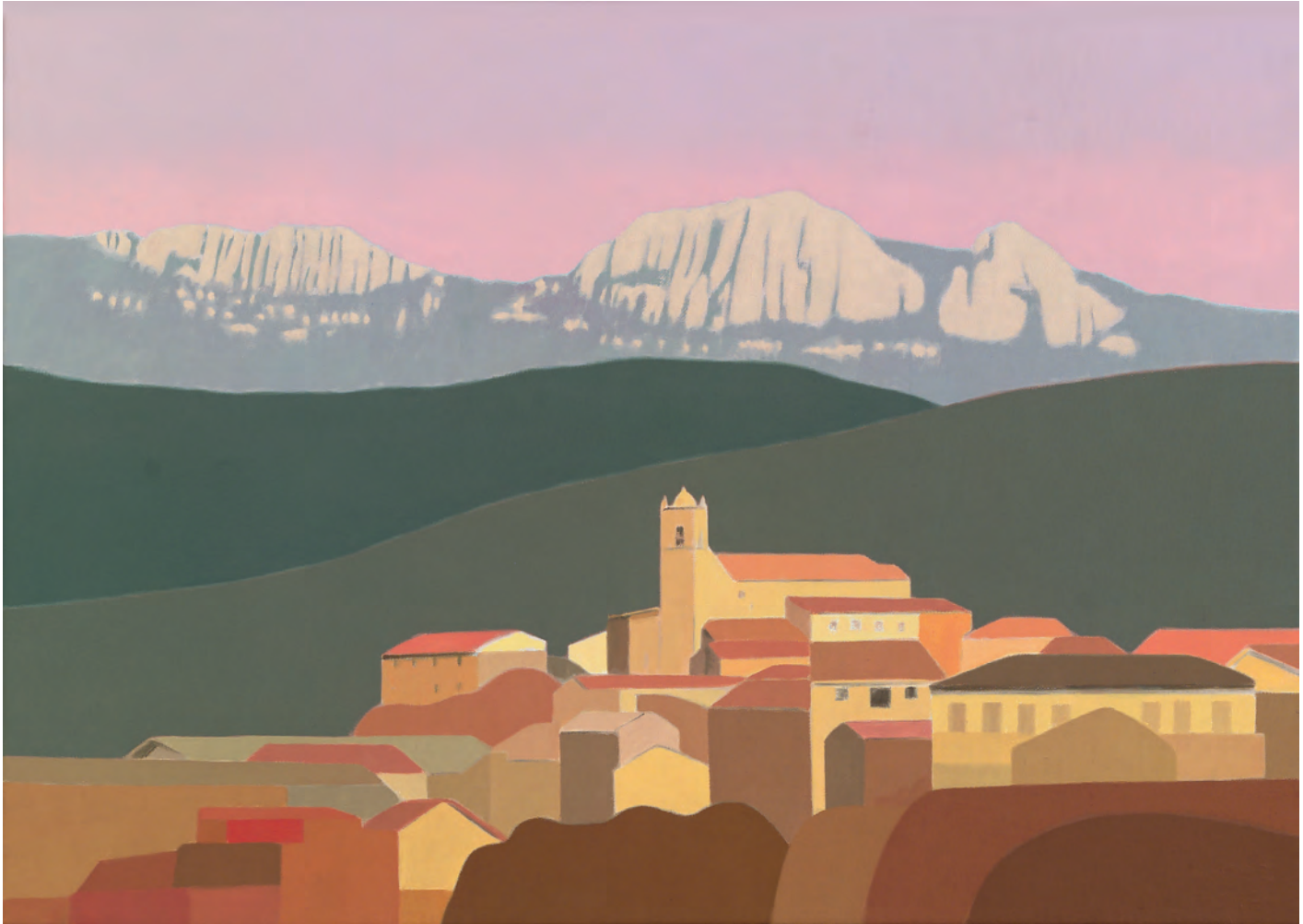
Espronceda 46x61 cm. o/l