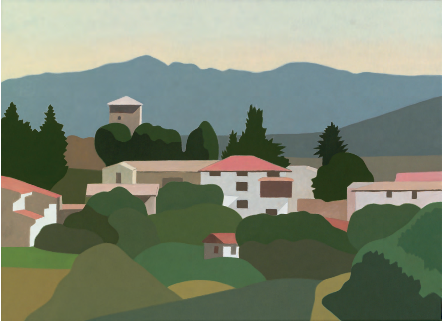
Muru Astrain 54x73 cm. o/l