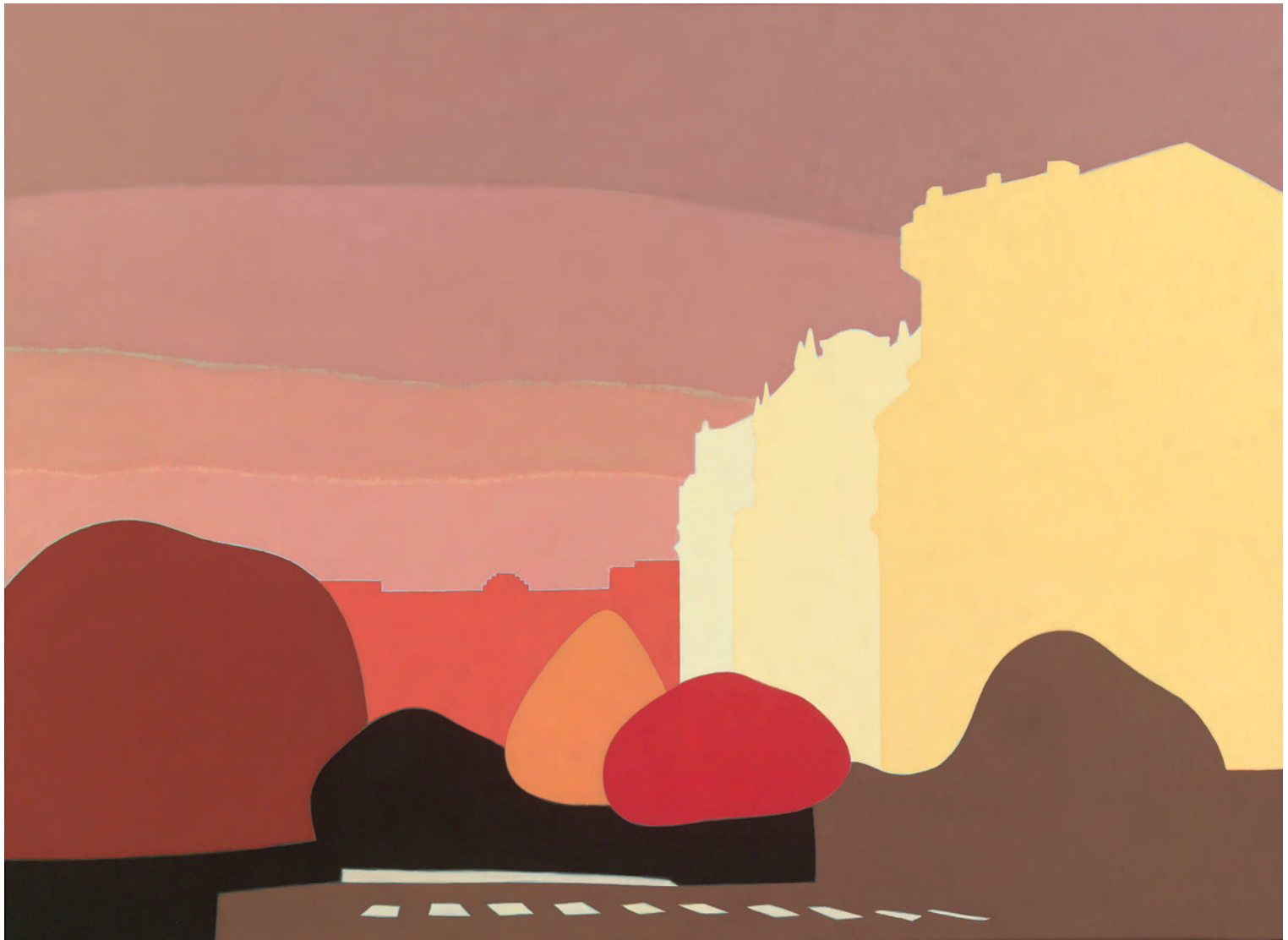
Avenida San Ignacio 73x100 cm. o/l