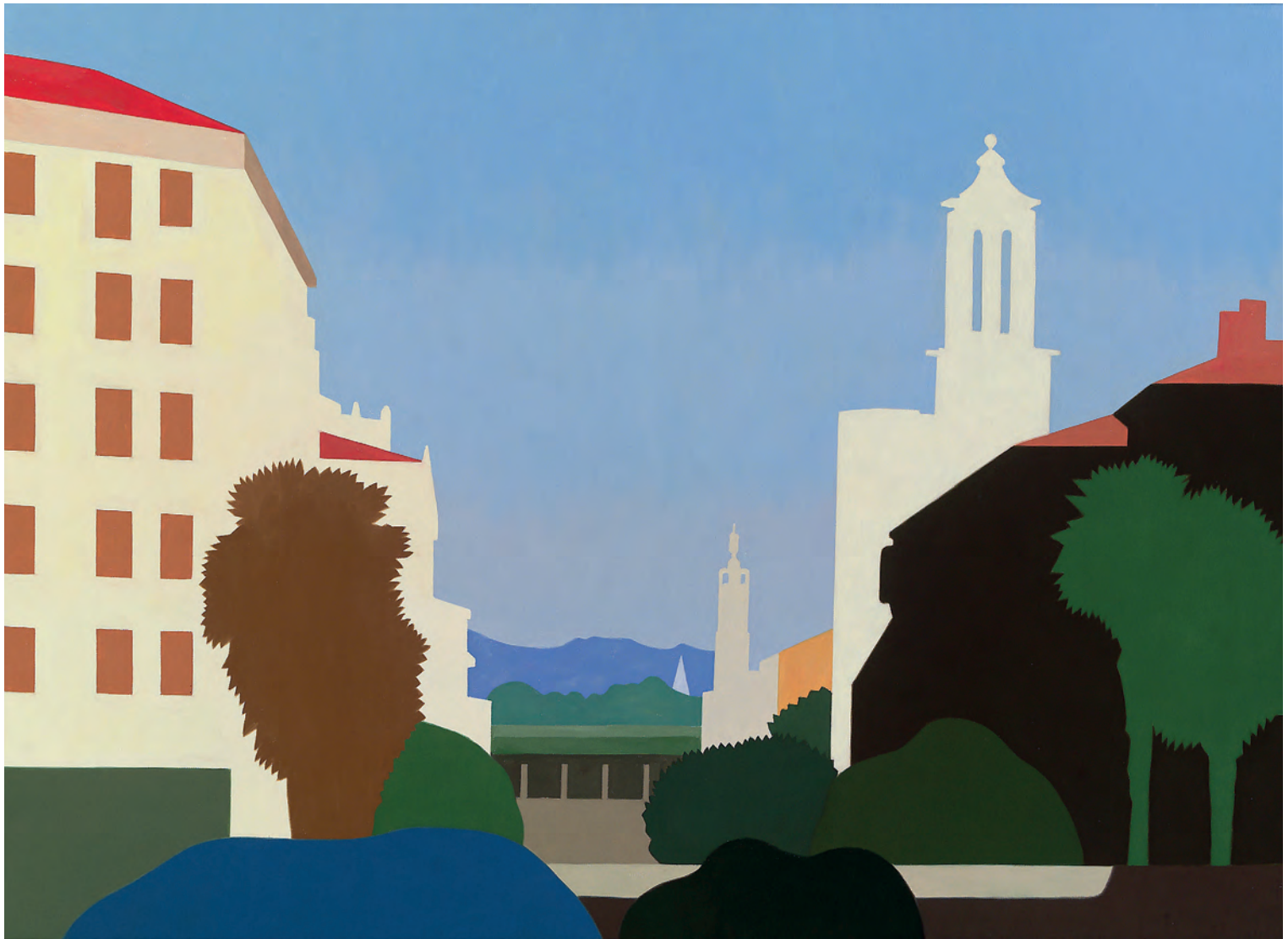
Calle Olite 73x100 cm. o/l